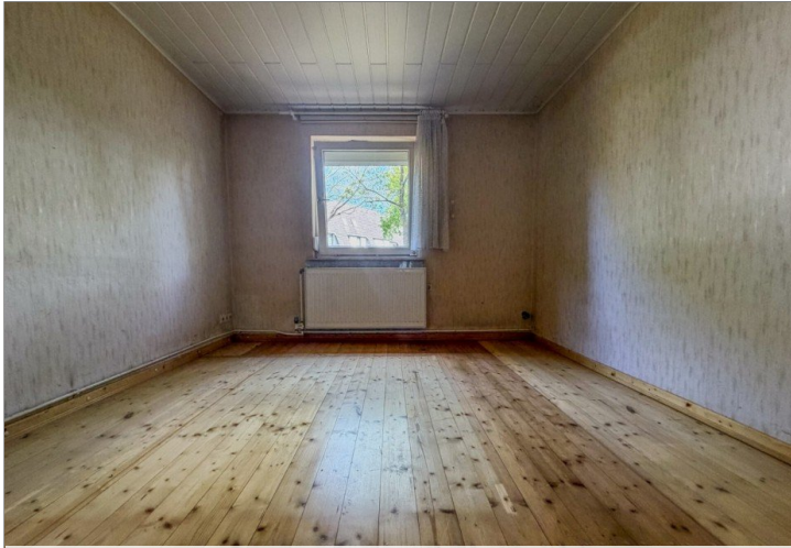
Zimmer I EG