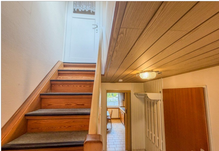
Aufgang in das Obergeschoss