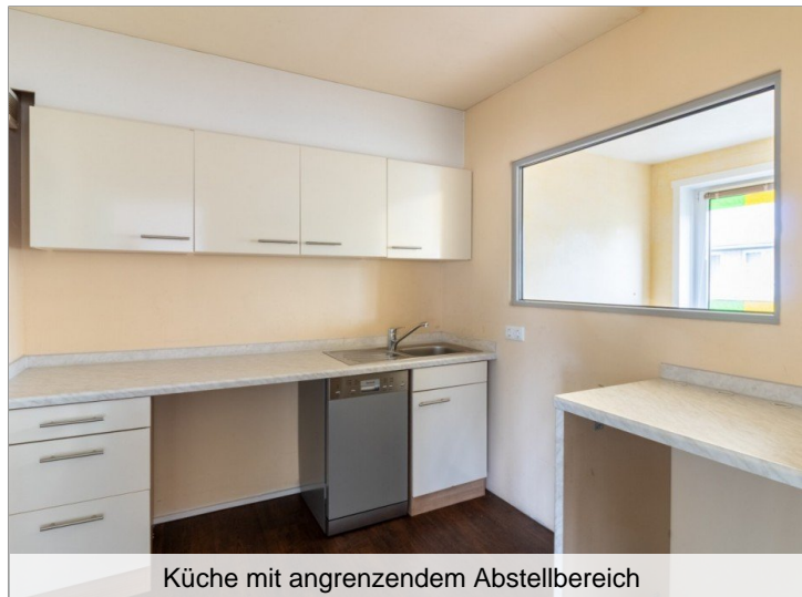
Küche mit angrenzendem Abstellbereich