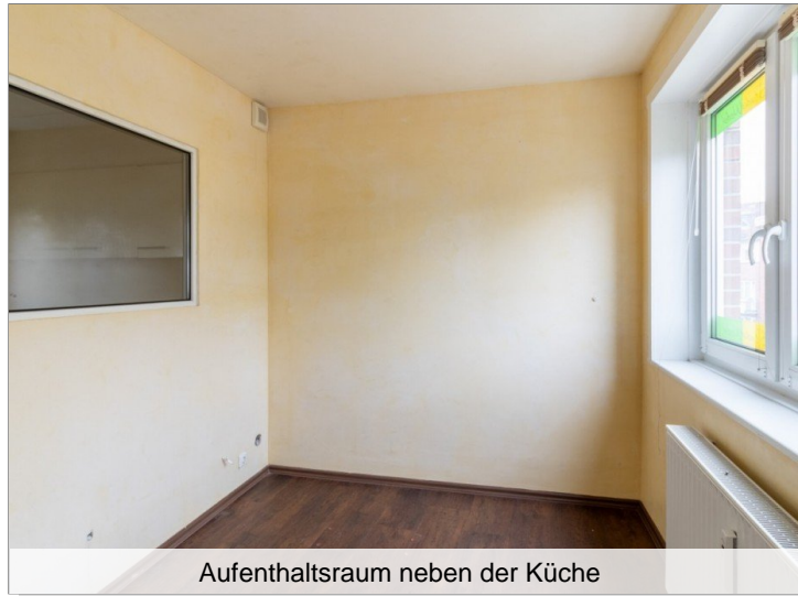
Aufenthaltsraum neben der Küche